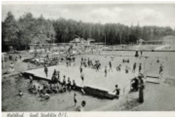
Malina - Groß-Sorau (1)